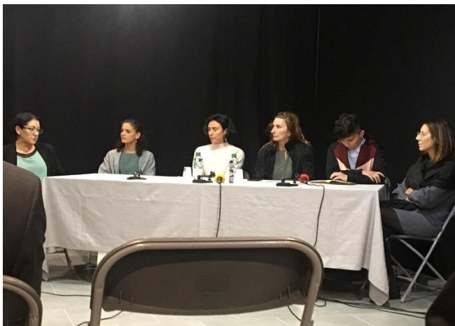
Table ronde 1 L'impact du dispositif en région